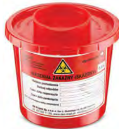
DZ.1200.03 0.5 L