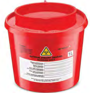
DZ.1200.05 1 L DZ.1200.06 3 L DZ.1200.07 5 L DZ.1200.09 10 L