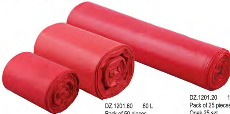
DZ.1201.35 35 L Pack of 50 pieces Opak.50 szt