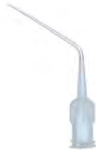
DR.9800.02 Luer lock